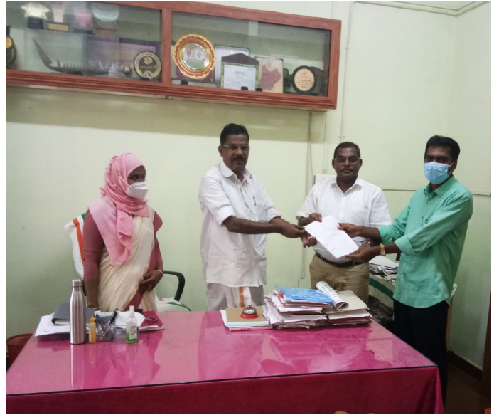
■ ഉളിക്കൽ ഗ്രാമപഞ്ചായത്ത് എഗ്രിമെന്റ് കൈമാറുന്നു