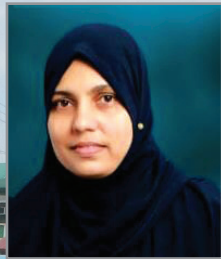
നസിയത്ത് ടി.സി. പ്രസിഡന്റ്, ഇരിക്കൂർ ഗ്രാമപഞ്ചായത്ത്