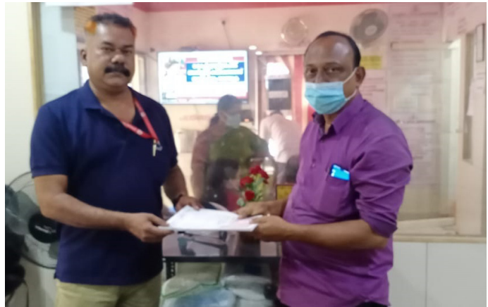
■ ജൽ ജീവൻ മിഷൻ ത്രികക്ഷി കരാർ വെളിയം ഗ്രാമ പഞ്ചായത്ത് സെക്രട്ടറി നിർവ്വഹണ സഹായ ഏജൻസിയായ എം.എസ്.എസ്.എസിന് കൈമാറുന്നു.