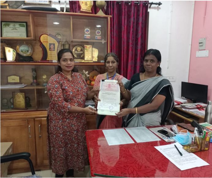
■ ജൽ ജീവൻ മിഷൻ ത്രികക്ഷി കരാർ പുതുപരിയാരം ഗ്രാമപഞ്ചായത്ത് നിർവ്വഹണ സഹായ ഏജൻസിയായ മിററിന് കൈമാറുന്നു.