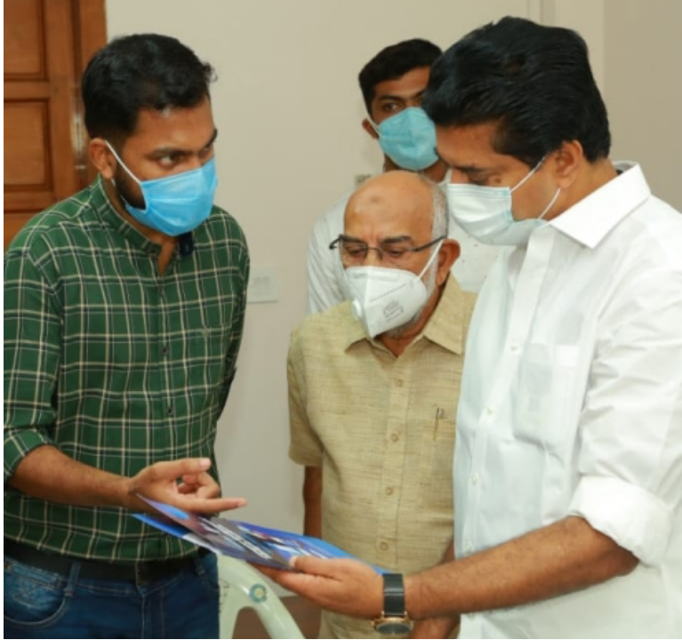
ത്തോടെ നടപ്പിലാക്കുന്നത് വർക്ക്മേറ്റ് സോഷ്യൽ ഡവലപ്പ്മെന്റ് സർവ്വീസ് സൊസൈറ്റിയുടെ നേതൃത്വത്തിലാണ്.

മലപ്പുറം ജില്ലയിലെ എടരിക്കോട്, പറപ്പൂർ, ഇല്ലിപ്പിലാക്കൽ, പാലാനി, ഊർങ്ങാട്ടീരി പഞ്ചായത്തുകളിലെ ജലനിധി കുടിവെള്ള പദ്ധതികളുടെ മീറ്റർ റീഡിംഗും അനുബന്ധ പ്രവർത്തികളും കമ്പ്യൂട്ടർ സോഫ്റ്റ്‌വെയറിന്റെയും ആൻഡ്രോയിഡ് അപ്ലിക്കേഷന്റെയും റീഡിംഗ് മെഷീനിന്റെയും സഹായ