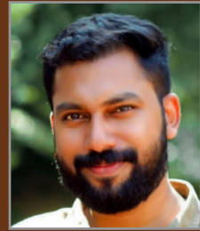
എം ഫവാസ് പനയത്തിൽ സെക്രട്ടറി വർക്ക്മേറ്റ് സോഷ്യൽ ഡവലപ്മെന്റ് സർവ്വീസ് സൊസൈറ്റി