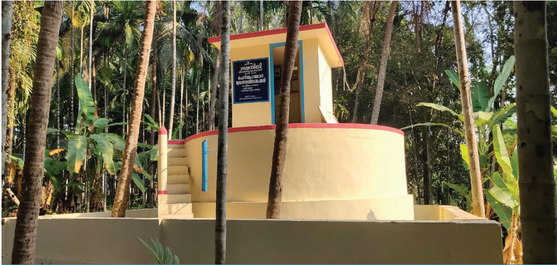
ചെറിയ പലോറ കുടിവെള്ള പദ്ധതി കിഴക്കോത്ത് നവീകരിക്കുന്നതിന് ശേഷം