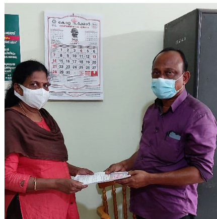
■ ജൽ ജീവൻ മിഷൻ ത്രികക്ഷി കരാർ ഇടമുളയ്ക്കൽ ഗ്രാമ പഞ്ചായത്ത് സെക്രട്ടറി നിർവ്വഹണ സഹായ ഏജൻസിയായ എം.എസ്.എസ്.എസിന് കൈമാറുന്നു.