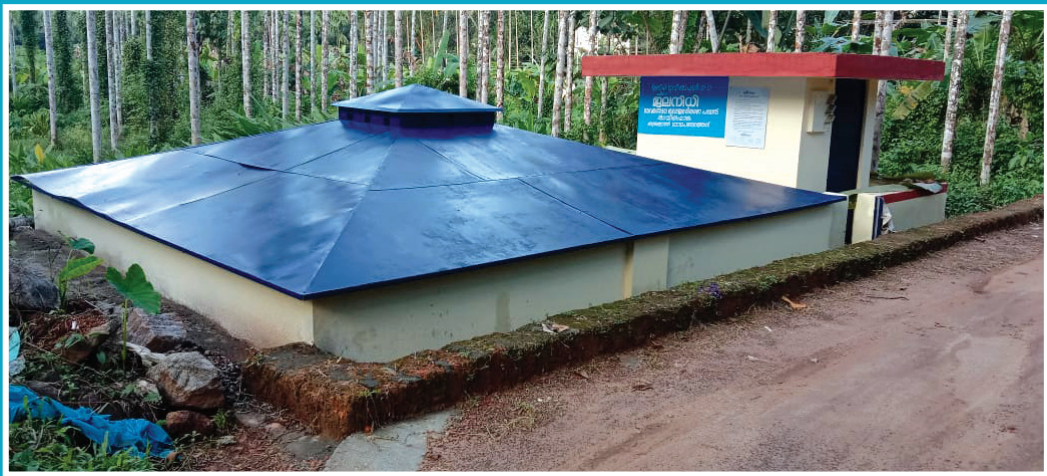
വെറകുന്ന് കുടിവെള്ള പദ്ധതി കിഴക്കോത്ത് സുസ്ഥിരതാ പദ്ധതിയിലൂടെ നവീകരിക്കുന്നതിന് മുൻപും ശേഷവും